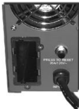
Emplacement du port Intellislot