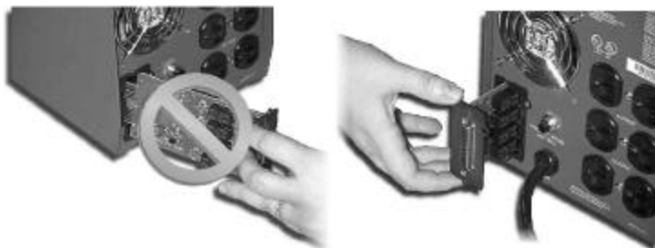
Orientation de la carte et de la baie